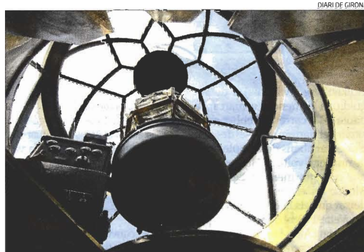
L'òptica del far del Cap de Salou i la màquina de rotació.