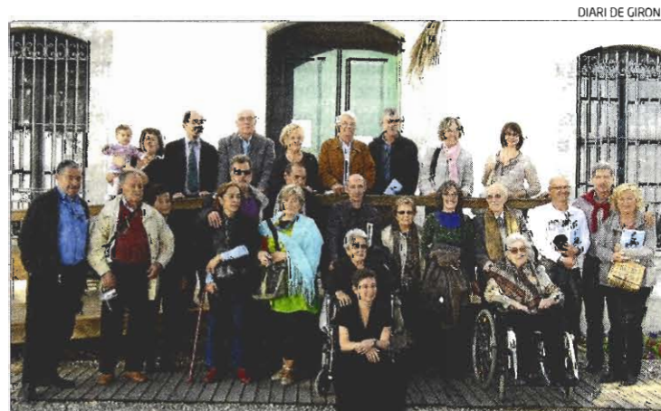
Trobada de farers i familiars el passat 16 d'octubre a Tossa de Mar.